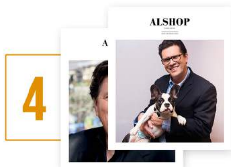
Edições da Revista AlShop